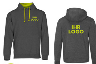
Voll im Trend Coole Hoodies in stylischer Ausführung

Unser ganzheitlicher Ansatz zur Mitarbeiter*innen-Bindung unterstützt Ihr Personalmarketing auf vielen Ebenen. Es sorgt dafür, dass Ihr Team langfristig motiviert, engagiert und produktiv bleibt. Investieren Sie in Ihre Mitarbeiter und sehen Sie, wie positiv sich dies auf Ihr Unternehmen auswirkt.