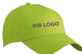
Einfach und gut Caps für Beruf und Freizeit in individuellen Designs