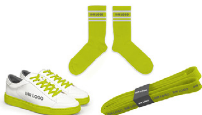
Mehr als Hemden und Krawatten Firmen-Sneaker, Schnürsenkel und Socken für Messen und Events

So sorgen Sie dafür, dass Mitarbeitern ihren coolen Hoodie auch in der Freizeit tragen. Marken-Identifikation und Personal-Marketing gehen hier perfekt Hand in Hand.